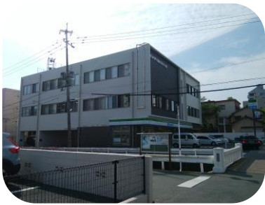
完成した熊本県労働者福祉会館

地域は国道の相次ぐ開通などもあって、復興の歩みがさらに加速しています。こうした中、昨年7月の豪雨で人吉球磨地域をはじめ県内全域に甚大な被害をもたらしました。九州は台風や地震などに見舞われることが多く、その度に復旧に取り組んできましたが、国や自治体も含めた防災・減災のあり方を考えていく必要があります。熊本本線は熊本地震や豪雨災害の教訓と課題を後世に伝え、引き続き安心・安全な鉄道づくりに取り組んでいきます。