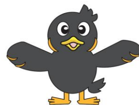
JR九州労組マスコットキャラクター