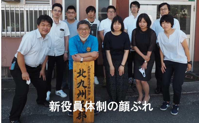
新役員体制の顔ぶれ

の島本代議員を選出し、冒頭、西委員長が「コロナ禍の中でも安全安定輸送に頑張っている組合員の皆さまに敬意を表します。JR東日本の夏季手当が2.4ヶ月、プラス5000円であったことは、大量脱退で労働組合の影響力が低下したの