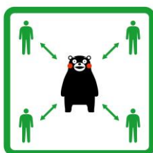
くっつかないモン #KeepDistance

世界的に猛威を振るっている新型コロナウイルス感染症ですが、熊本県がこのほど感染防止対策を呼びかける「くまモン」の啓発用イラストを作成しました。厚労省は、感染症防止対策に「手洗い・うがい」「咳エチケット」が有効としています。加えて「三密(密閉・密集・密接)を避ける行動」も必要とされます。仕事上、三密を避けることは難しいですが、自らの感染予防するためにも感染防止対策の実行をよろしくお願ひします。