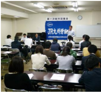
長崎地区集会の様子

中央本部からは、「労働条件改善の取組み(2019年度労働協約改訂)」、「中期労働政策ビジョンチャレンジ2023の取組み」、「当面するJR九州労組の取組み」について、労働協約改定交渉で改善に至った嘱託再雇用社員の雇用期間延長の具体的内容や、年末手当交渉に向けた中央本部の姿勢などを中心に提起されました。